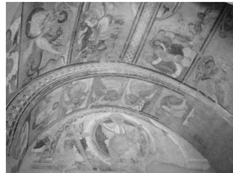
Le narthex, recouverte de fresques

L'abbaye de Saint-Savin-sur-Gartempe est un des sites touristiques majeurs du Poitou. Ses fresques médiévales (XIe-XIIe S.) ont fait la renommée de cette abbaye inscrite au Patrimoine mondial de l'UNESCO depuis 1983. Préservées au XIXe S. sous l'impulsion de Prosper Mérimée, ses fresques ont inspiré à A. Malraux son surnom de "Sixtine romane". Le décor de la nef réalisé à 17m du sol retrace les épisodes de l'ancien testament mais avec les costumes, les techniques et la vision du moyen-âge.