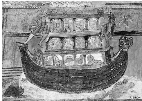
Fresque de l'arche de Noé